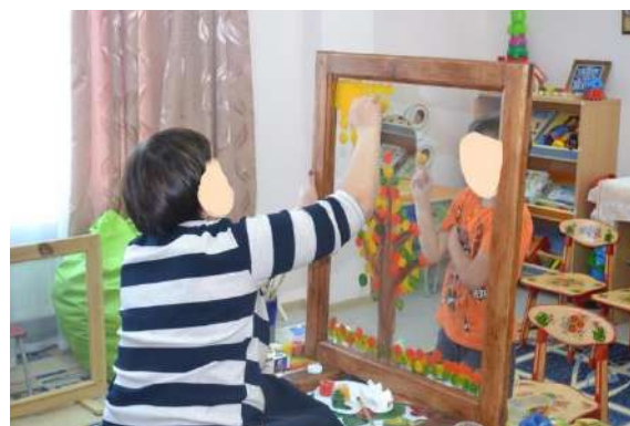
Рис. 5. Совместный рисунок с мамой «Осеннее дерево».

На данном занятии родитель смотрит на мир с позиции ребенка, отрывается от повседневных забот и вместе с ребенком создает продукт совместной творческой деятельности. В памяти через реальные действия закрепляется чувство «я могу понимать», «я могу принимать ребенка», «я могу чувствовать своего ребенка» и в итоге «я могу быть успешным родителем!». Результат совместной творческой деятельности – совместный рисунок – с разрешения родителей запечатлен на фото и видео. Пережитый позитивный опыт, с чувством «я могу быть успешным родителем», создает ресурс в памяти для дальнейшего воспитания ребенка и совершенствования своих родительских компетенций.